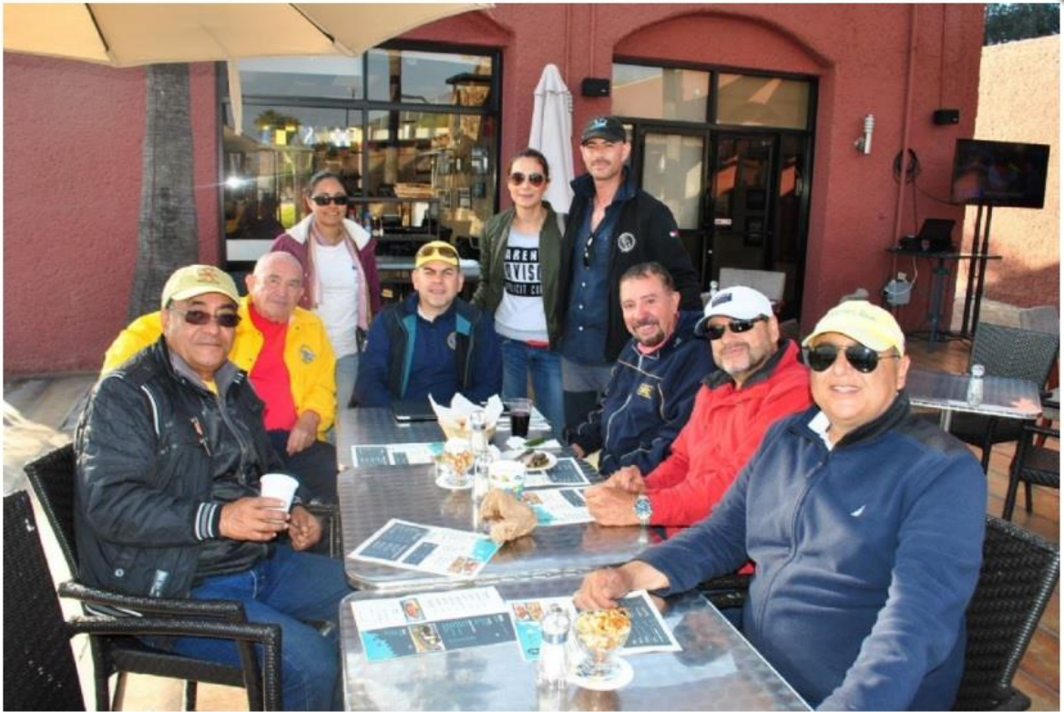
Miembros del Club Náutica Baja celebrando 18 años de actividad y hermandad.