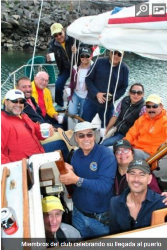
Miembros del club celebrando su llegada al puerto.