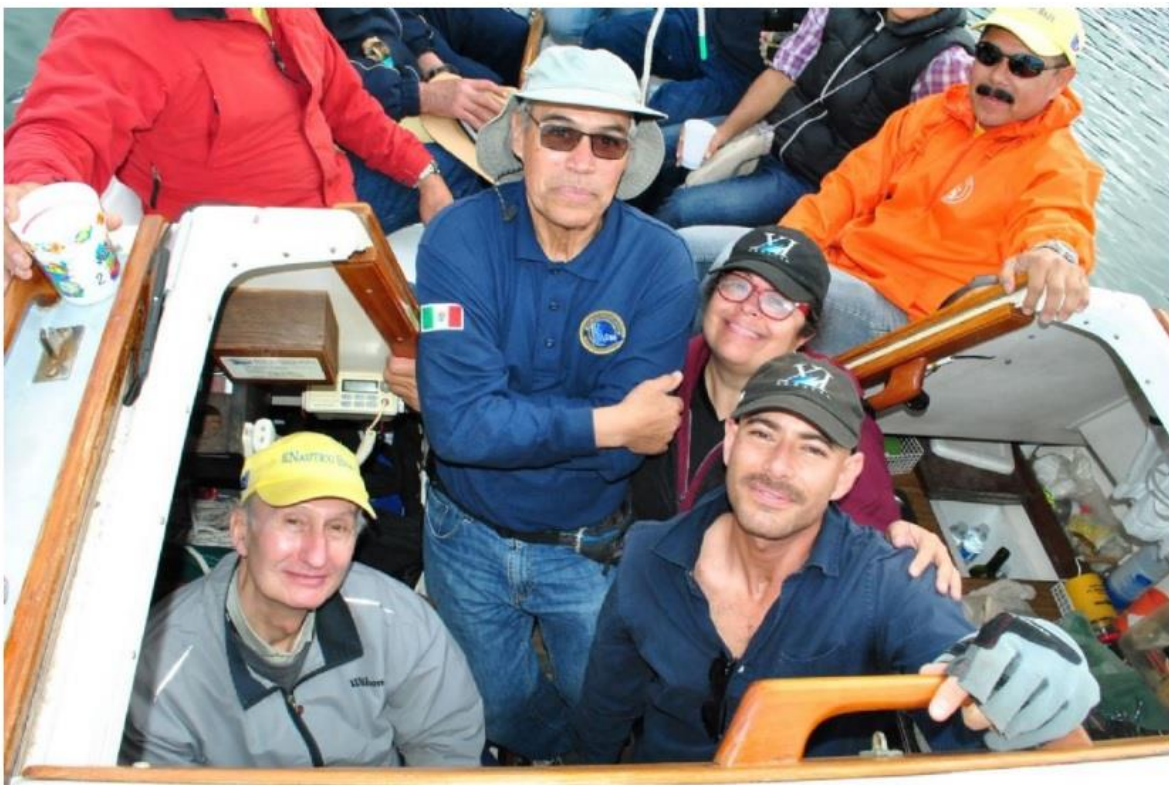
El convivio fue disfrutado por todos, posterior a la regata.