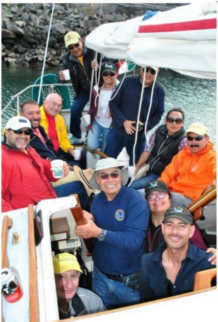
Miembros del club celebrando su llegada al puerto.