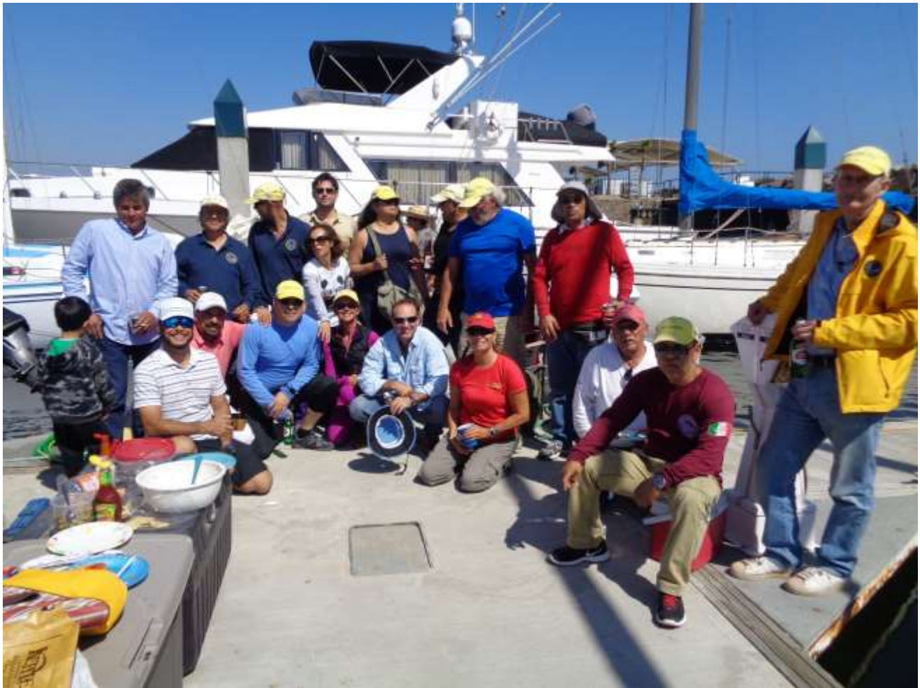
La tribu náutica del muelle G