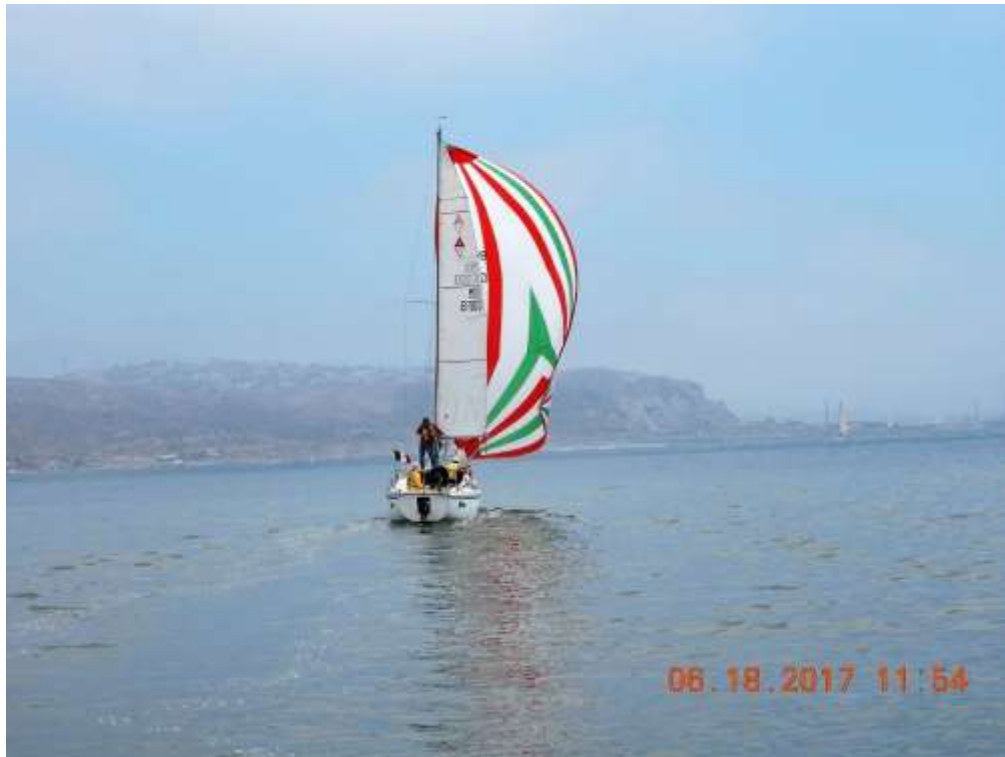
YATEMG también probando con spi