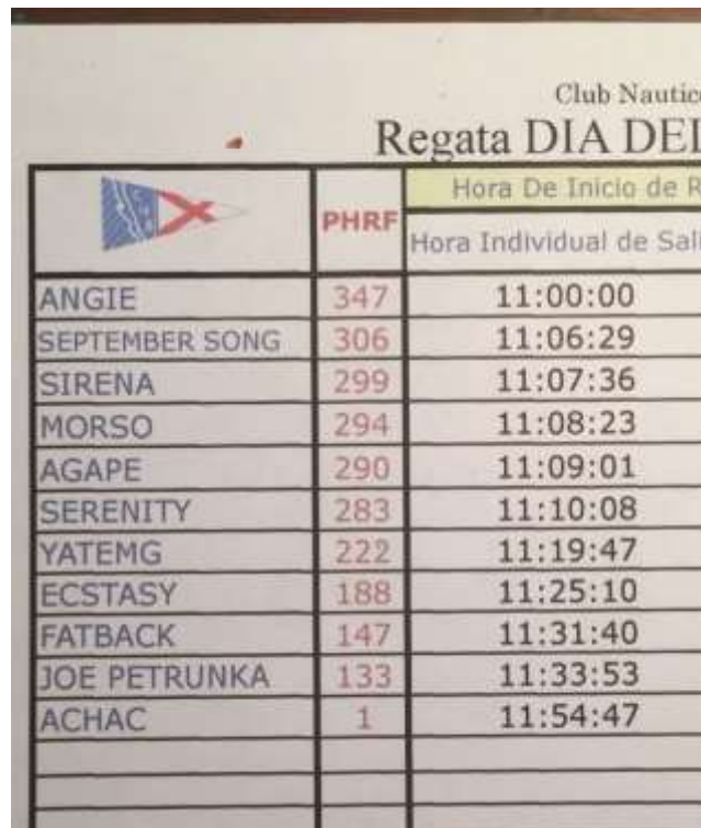
Hora de salida individual