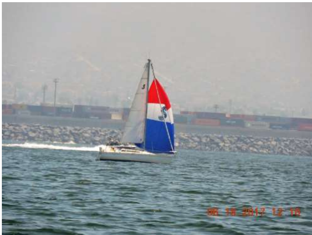
ÁGAPE levantando el spi

Ágape navegó en solitario y hasta el asimétrico puso a volar