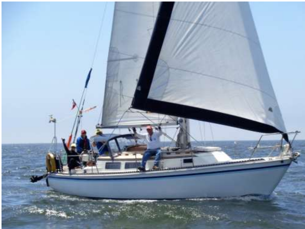
SEP. SONG llegando a la meta

Después de que llegó ANGIE a la meta, levantó la boya correspondiente y SERENITY la otra y vámonos al muelle a festejar y todos de traje.