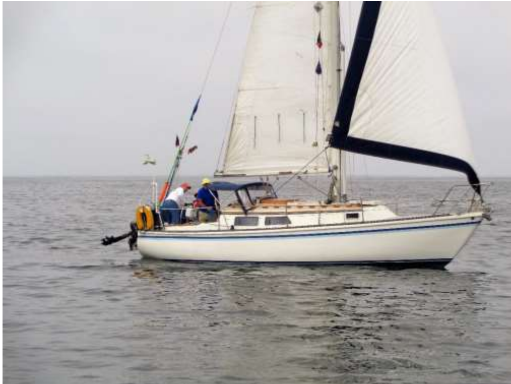
SEPTEMBER SONG, The official language on this boat is English