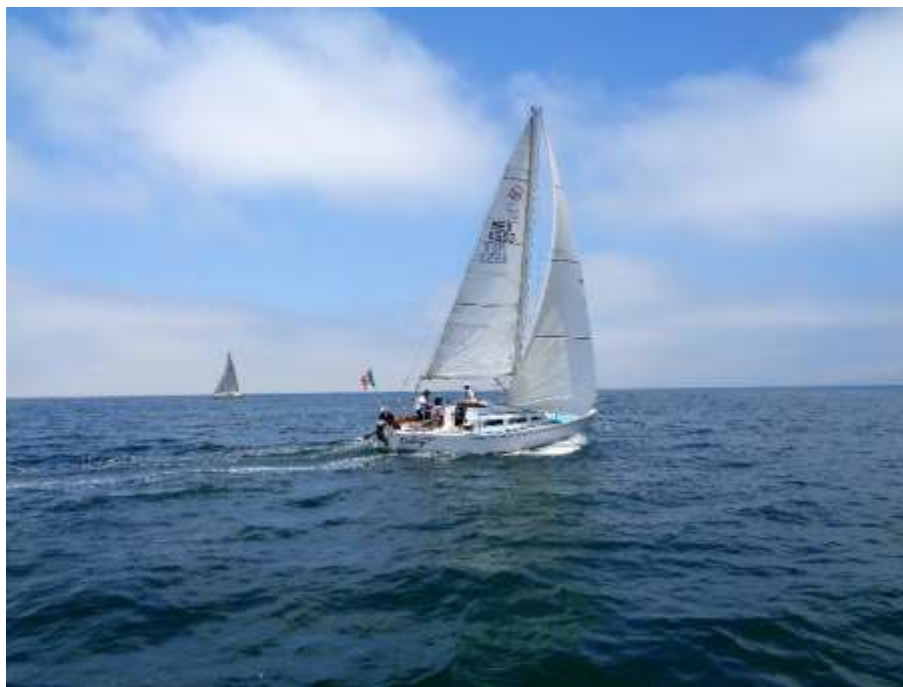
ECSTASY rebasando a YATEMG