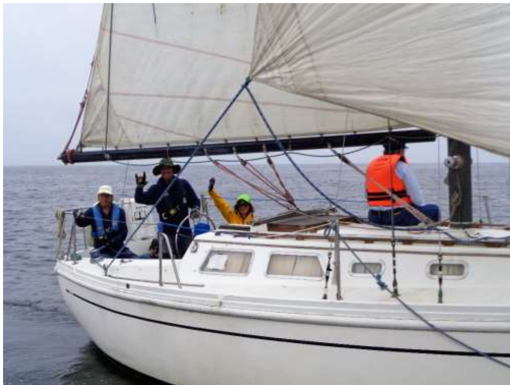
SERENITY y sus piratas