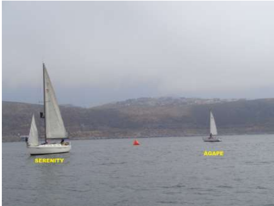
Instaladores oficiales de boyas

Habiendo cumplido con el protocolo anterior SERENITY y ÁGAPE salen al mar para instalar una boya a barlovento y otro para la salida.