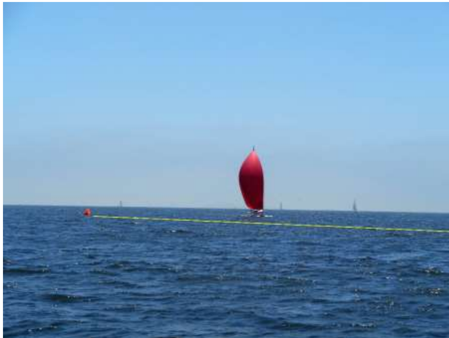
FATBACK acercándose a la meta

En la última pierna de la ruta se enfilaron a la meta SERENTIIY, ECSTASY y YATEMG para ocupar los tres primeros lugares.