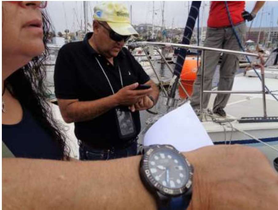
Sincronizando relojes y aclarando dudas